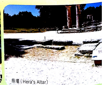
祭壇 (Hera's Altar)